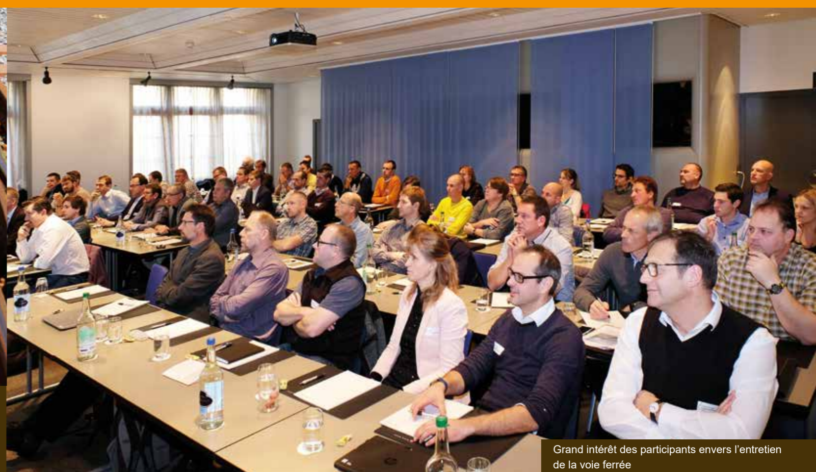
Grand intérêt des participants envers l'entretien de la voie ferrée