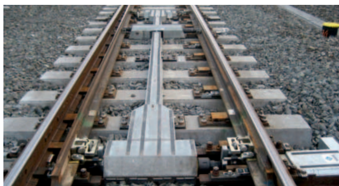
Innenliegendes Kraftübertragungsgestänge PGS mit Verschlusssystem „Sperlock“ und in die Schwelle integrierten Weichenantrieb „Ecostar“.